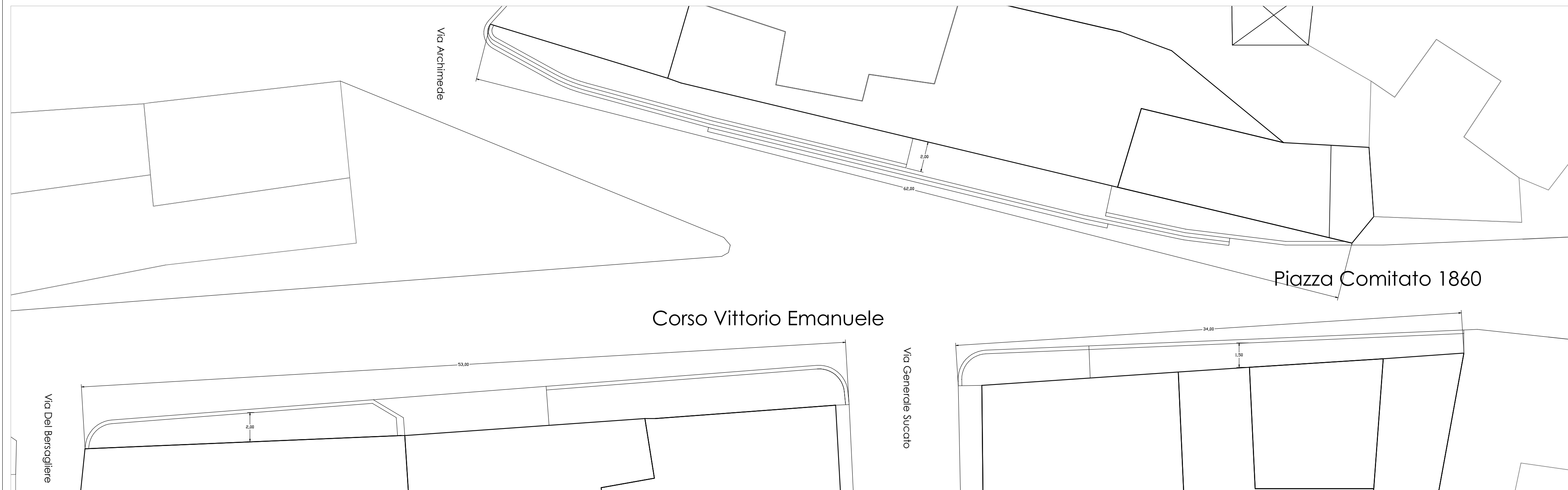
Planimetria marciapiedi da Piazza Comitato verso via Archimede, via Generale Sucato e via Del Bersagliere in scala 1:200